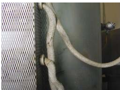
Aislante térmico textil en horno