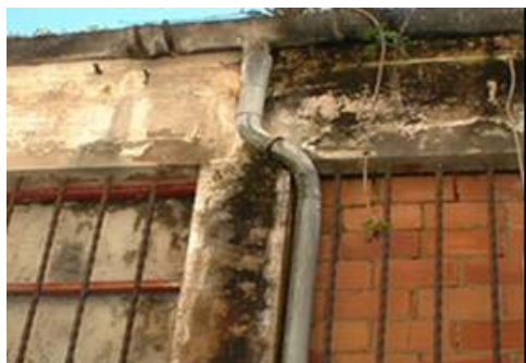
Canalón y bajante de recogida de aguas