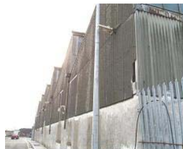
Revestimiento externo de fibrocemento