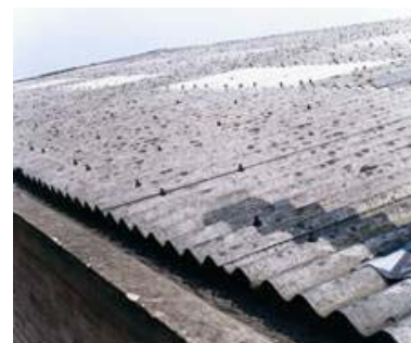
Planchas onduladas en techo