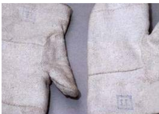
Guantes de laboratorio