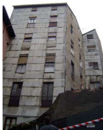
Paramentos de fachadas