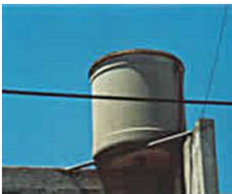
Tanque de agua de fibrocemento