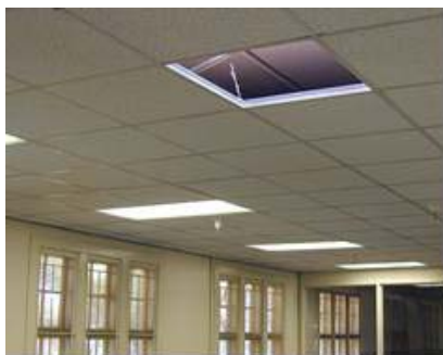
Placas de falso techo acústico