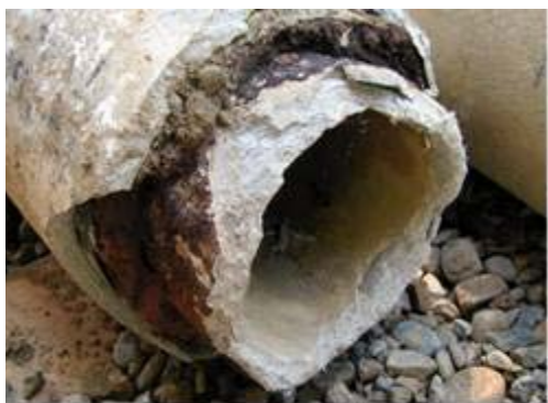
Tubería de fibrocemento