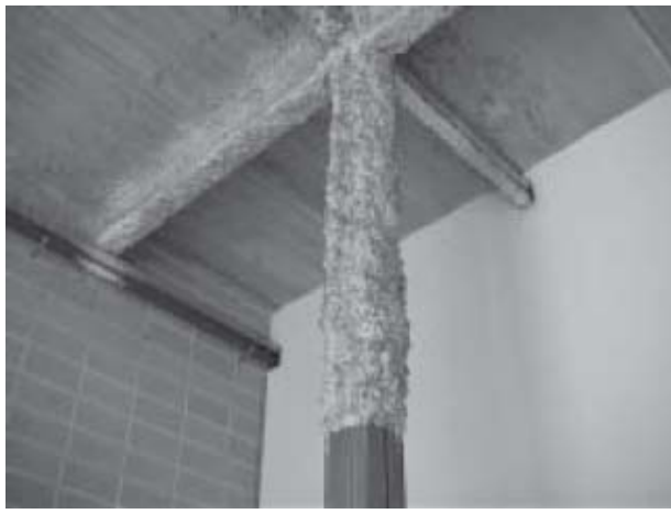
Figura 8 Calorifugado (aislante térmico en conducto de agua caliente)