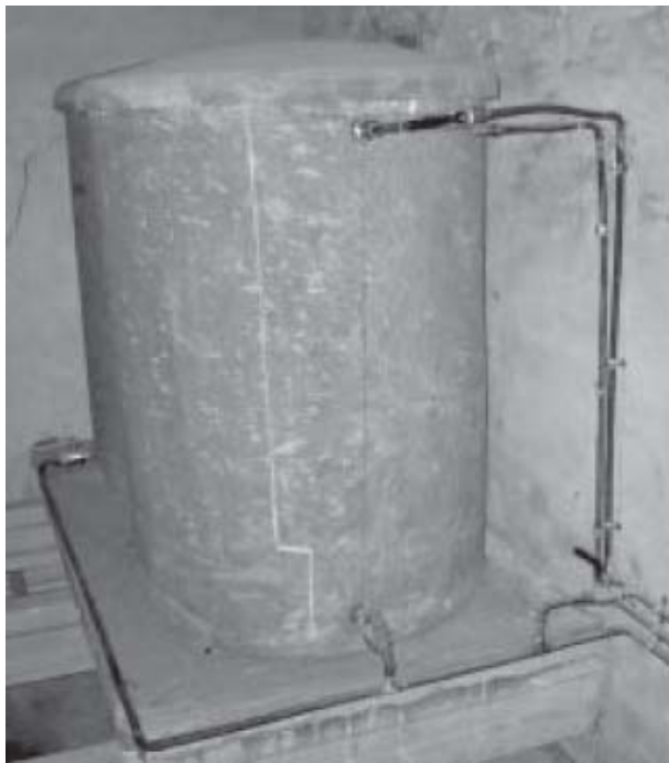
Figura 10 Conducto de aireación de fibrocemento