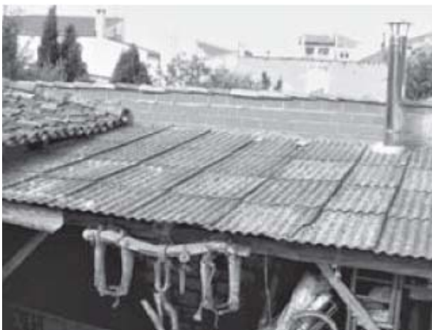
Figura 11 Cubierta de fibrocemento muy deteriorada