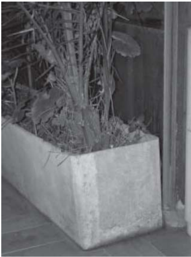
Figura 4 Exposición ambiental exterior; movimiento de tierras en vertedero incontrolado