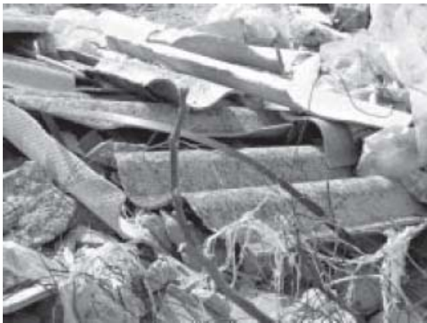
Figura 5 Exposición laboral: retirada placas fibrocemento