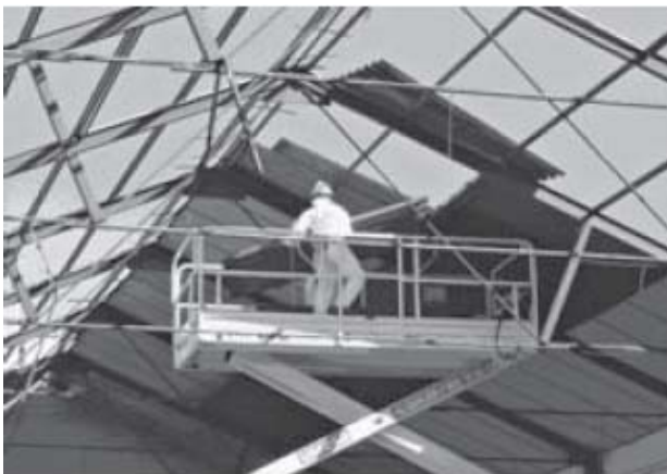
Figura 6 Placas de falso techo con contenido en amianto